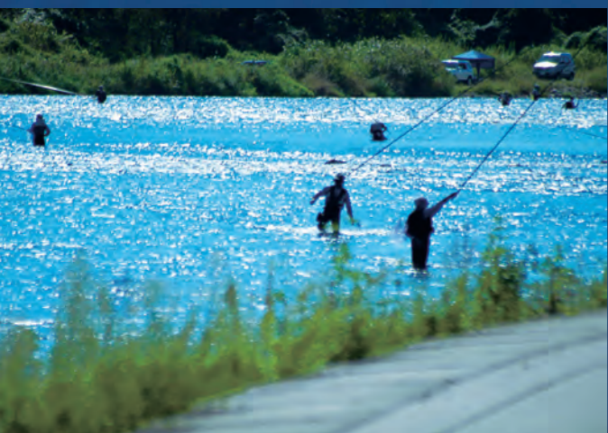
那珂川の恵みを職人たちがお届けします