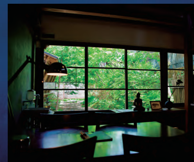
各店舗では非日常の時間を過ごせます