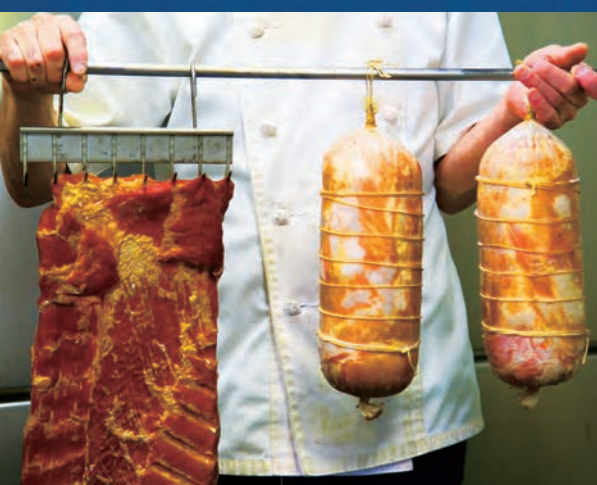
20年前からずっと変わらない愛情と製法で手造りしています

2021年、地元の食材を使ったBBQご当地選手権大会に栃木県の代表として出場。そこで全国優勝を飾った逸品。豚肉は、小山市産のブランド豚「おとん」を使用。「おとん」は、肉質が柔らかく脂が甘いのが特徴。職人が守り続けている一つひとつ丁寧に手ひねりして造る本物の味をどうぞお楽しみください。